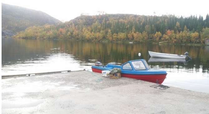
Og her to dager senere, den 24.