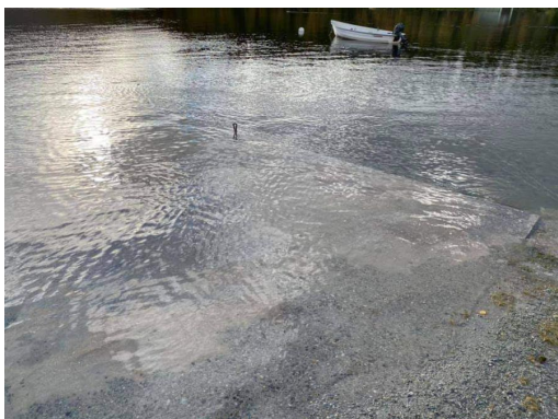
Slik så det ut den 22.

Torsdag 24/9: Kl 08, 3,3°, min 0,5°, disig luft i høyden og noen lave skyer fra vest, litt yr i lufta og våt trapp og bakke, men tegn til oppklaring, vindstille ved huset. Til Nygård og handlet, og tok med Tor Helge og pargas til Odd Even og Brynjar tilbake. Bare finvær og blikkstilte vatn.