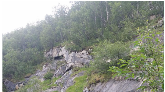
I overkanten av Svartflåget fant jeg kanskje berget som gir meg Internett.