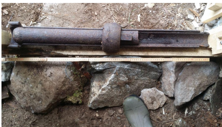
Da jeg skulle grave torv til taket på naustet fant jeg denne gjenstanden av støypejern. Det må ha vært ett ledd av en vannledning, og kommer sikkert fra Bodø.

Mandag 17/8. 91,5. Til Kroken 10:00, hytta 10:25, høysp 10:40, fløystrengen 10:48, K 11:00. Flo sjø. Ferdig taket, fått på vinsja, lagt foreløpige lunner av rekved. Fisket 4 sei-morter. Fra naustet 18:32, fløystrengen 18:52, høysp 1907, hytta 19:30, hjemme 20:10 (med kantarell-plukk). Opplett og fint arbeids-vær fra i 9-tida, Før det yr og grått, max 13,6°, min i natt var 4°. Kokte seien, men spiste lite pga dårlig mage.