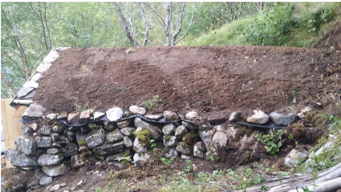
Her ser vi at knotoplasten ligger utenfor steinmuren, så vannet ikke trenger inn i naustet.

Tirsdag 18/8: Kl 08, 8,8°, sol fra nesten klar himmel, makrellskyer fra vest, tørr trapp men dugg i gress, svak vestlig vinddrag. ATV til Eggesvika med bensin, dregg, tau og div materialer., Møtte Odd Even, fikk båten til kroken og inn i naustet. Fikk verktøy etc fra Kroken til Eggesvika med Odd Even. Hjem med sakene fra naustet og jakttårnet. Kl 20, 10,5°, max 19,4°, nydelig vær hele dagen, men overskyet i kveld. Kald sei med potet, agurksalat og rømme.