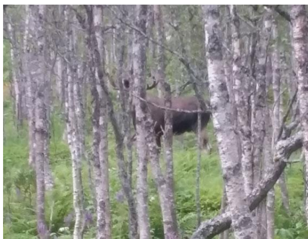
Elgen har sett meg ei stund, og er bare 30 skritt unna, så den er ikke særlig redd meg.

Søndag 16/8: Kl 09, 10,1°, min 8,4°, overskyet fra vest, opplett, tørr trapp men litt vått i gress, lett vestlig bris ved huset, vindproduksjon hele natta. Tur Trappbergskogen - Storsletta - hjem. 1kg+ multer, rypekull med 5 flygedyktige kyllinger, på Storsletta møtte jeg "gårds-oksen" på 30 skritt avstand. Den hadde 5 takker å høyre side, og var ikke særlig redd. Gledet meg til kald ørret eller sei med potet og rømme, men begge var ødelagt. Ikke vellykket hermetisering. Det ble ikke stedet en biff med potet, agurksalat og stekesjy. Kl 21:30, 8,1°, max 11,9°, opplett til ca kl 16, deretter regn i byger. Ble litt groggy på turen, med svie i brystet, og tenkte covid19, 8 dager etter bryllupet. Heldigvis hadde Mona ikke hørt om noen som var sjuke, og hun hadde snakket med de fleste.