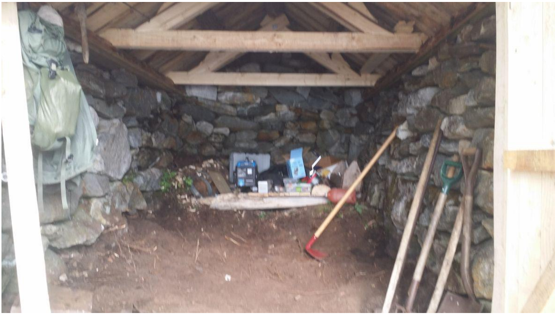
Naustet har fått tett tak, og det meste av torva er gjenbruk av det som var på det gamle, og rast ned innimellom murene.